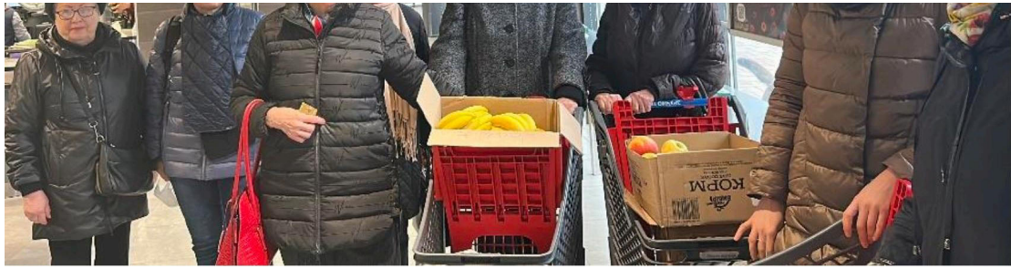
Les Soroptimistes du club de Lviv font des achats pour l'orphelinat de Liyubyn Velyky